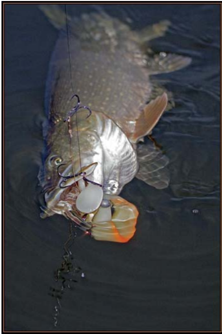
Je recommande de commencer par sonder les eaux avec un gros shad, entre 2 à 4 m de profondeur.

Je le disais, il y a énormément de modèles de gros leurres sur le marché et vous n'aurez que l'embaras du choix. Un gros shad peut être utilisé dans n'importe quelle situation. Bien entendu, les jerkbaits, spinnerbaits et « twitch baits » ont leurs avantages, mais je peux vous assurer qu'un gros shad fonctionnera quel que soit l'endroit où vous pêchez ; les brochets et sandres succombent à tous les coups. Si vous ne disposez que de peu de temps mais voulez désespérément leurrer un beau poisson, il est d'autant plus recommandé d'utiliser des shads.