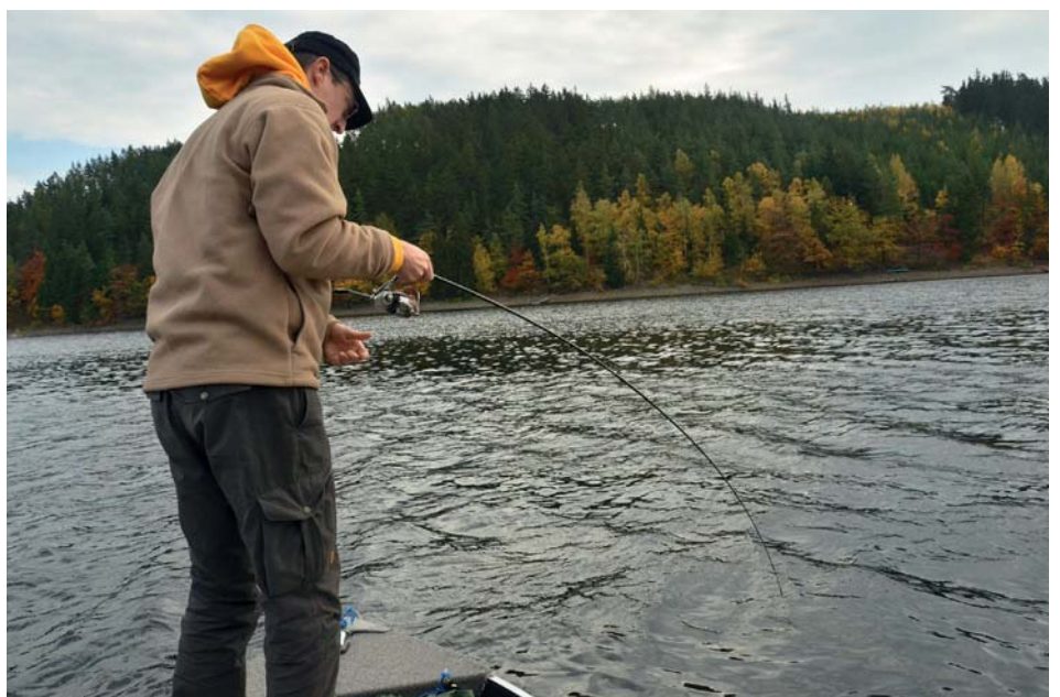
Si vous souhaitez réellement prendre un poisson énorme, vous devez opter pour un lac de bonne superficie et pêcher les zones où la profondeur est la plus importante.

Faites dans la simplicité : une canne spinning puissante et légère de 2,5 m (une Greys Prowler Platinum Specialist 80 g, par exemple), afin de pouvoir lancer toute la journée sans se fatiguer et un moulinet spinning 3000-4000 garni d'un fil d'une résistance de 20 kg. En bas de ligne, j'utilise du titane ou du fluorocarbène de 90/100. Et voilà : c'est tout ce dont vous avez besoin !