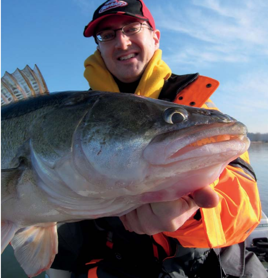
Un gros brochet ou sandre se nourrit naturellement de grosses proies.