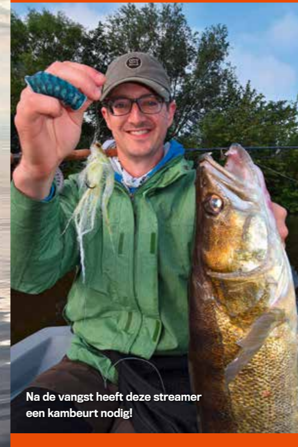
Na de vangst heeft deze streamer een kambeurt nodig!

Ongelooflijk effectieve snoekbaarsvliegen zijn te vinden op www.wunsch-fliege.de (vraag Jan gewoon om 'Steffens Streamers', verzending naar andere landen mogelijk) of op www.adh-fishing.de , vooral van Pike Terror Flies.