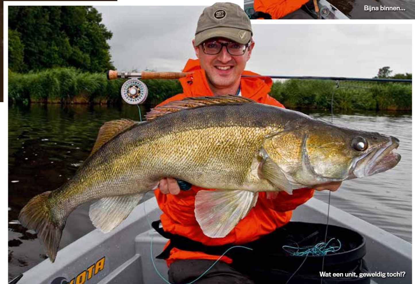
Wat een unit, geweldig toch!?