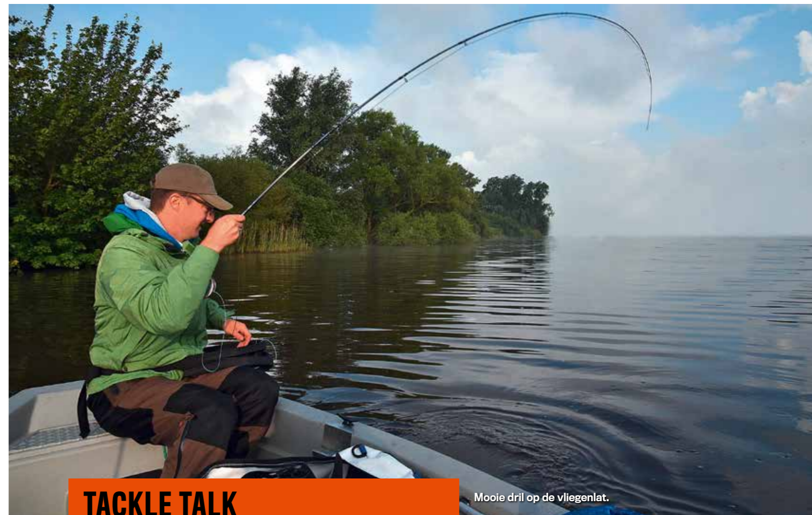
Mooie drill op de vliegenlat.