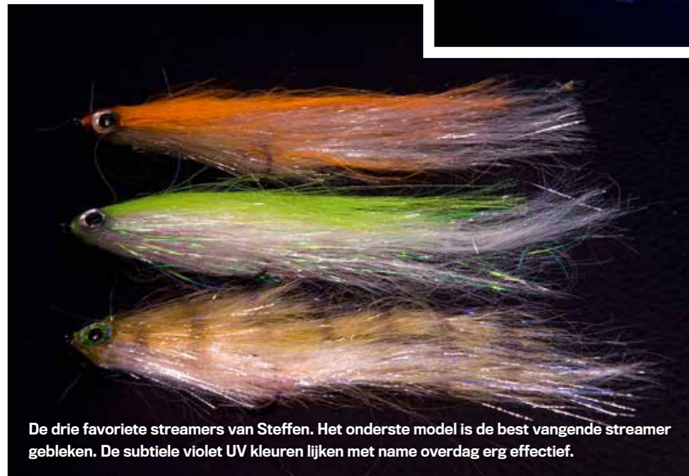
De drie favoriete streamers van Steffen. Het onderste model is de best vangende streamer gebleken. De subtiele violet UV kleuren lijken met name overdag erg effectief.

streamer lekker zacht te zijn, omdat we heel langzaam moeten vissen, terwijl we tegelijkertijd een verleidelijke actie willen behouden. De streamer moet 12-18 cm lang zijn. Probeer in troebel water zeker UV-actieve materialen uit (bijvoorbeeld oranje, fluorescerend groen of violet). Maar zelfs in zeer troebele wateren kan subtiele decoratie vaak een grote hit zijn. Onverzwaaarde streamers lenen zich goed voor deze techniek, als de diepte het toelaat, en zijn vaak beter omdat ze langzamer zinken. Afhankelijk van je persoonlijke voorkeur, of vertrouwen, kan het lonen om een ratel in te bouwen. Dit trekt vaak de aandacht van snoekbaars in troebel en donker water. Afhankelijk van het water is het in het begin vooral een kwestie van veel verschillende elementen uitproberen.