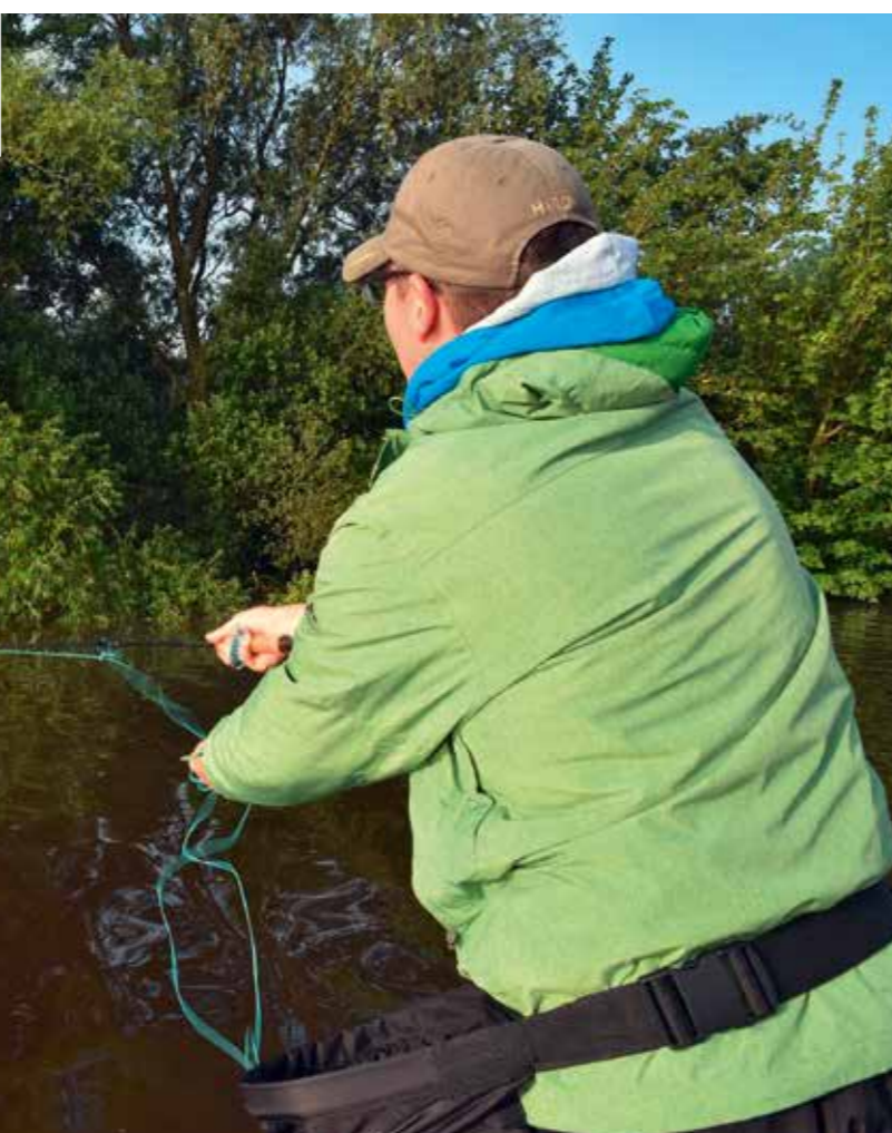
Voordeel van de streamer: tussen de takken laten zinken en daar gelijk tergend langzaam presenteren.

Een boot is praktisch noodzakelijk wanneer je voor struiken, bij sluisen en onder bruggen wilt vissen. Tevens is het zoveel makkelijker om je streamer los te maken wanneer deze ergens achter blijft hangen... Want één ding is duidelijk: wie snoekbaars wil vangen, moet een groot risico nemen. Met een spinhengel is het