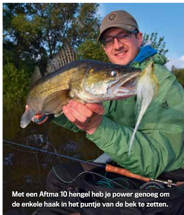
Met een Aftma 10 hengel heb je power genoeg om de enkele haak in het puntje van de bek te zetten.

wat betreft water- en stekkeuze, kies je het beste een water met een goed snoekbaarsbestand. Als het water licht tot erg troebel is, dan hebben we zelfs een goede kans om overdag grote snoekbaars te vangen.